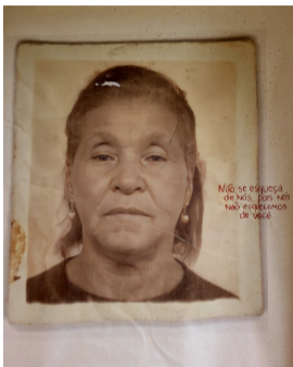
Às Margens do Velha - #12, 2022 Série Terreiros - Massuelen Cristina

Impressão em sublimação com tecido banhada em café e bordado 120x100cm